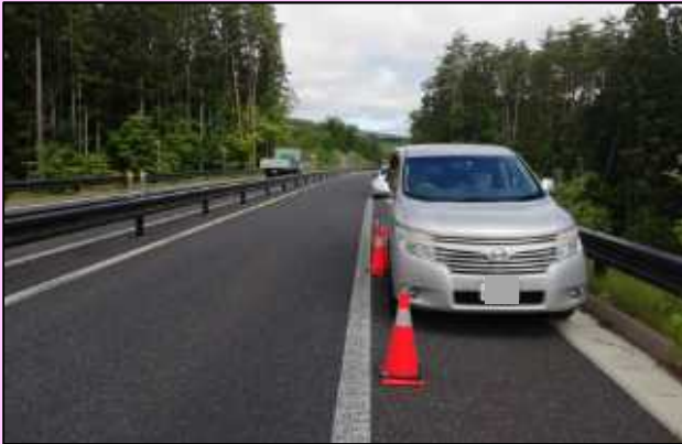
タイヤのパンクにより路肩に停車中の乗用車。

E46釜石自動車道では、自動車のガス欠やタイヤのパンクなどが原因で、路肩に停車する事象が毎年、数多く発生しています。故障で本線や路肩に停車した場合、車が滞留したり、追突されてしまう可能性があります。特に高速道路は走行速度が早いので一般道よりも制動距離(ブレーキを踏んでから停止するまでの距離)が長くなるため危険です。 E46釜石自動車を走行する前に、タイヤの空気圧を適正值にし、ガソリンを常に満タンにしておくことを心がけましょう。