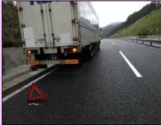
エンジントラブルにより停車中であるが、本線にはみ出して大変危険。