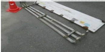
車両部品(サイドバンパー)