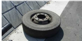
車両部品(大型タイヤ)