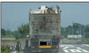
《落下しやすい積荷状況の例》