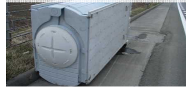
建設資材(仮設トイレ)