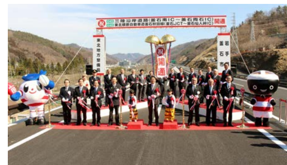
2019.3.9 テープカットの様子

平成31年3月9日の釜石JCTから釜石仙人峠IC間(延長6.0km)の の开通により全線开通了。これにより、東北横断自動車道 釜石秋田線(釜石～花巻間)の約80kmが 全線开通 しました。