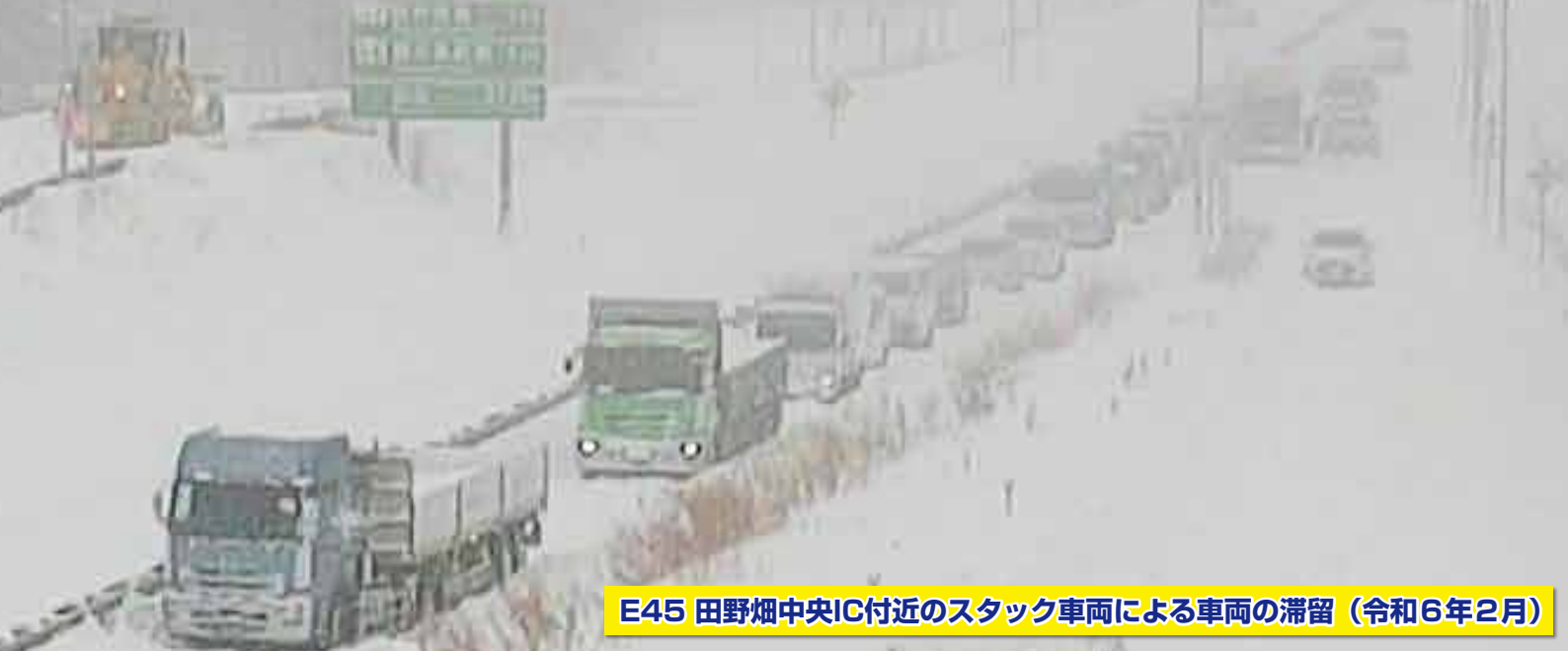
E45 田野畑中央IC付近のスタック車両による車両の滞留 (令和6年2月)

大雪予想時は、「出控え」や「予定変更・出発見送り」で、危険を回避する行動をお願いします！