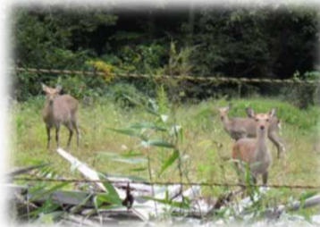
鹿さん! お騒がせしました。