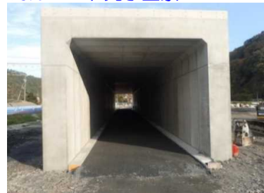
No.667プレキャストボックスカルバート完了全景

※トンネルなど復興道路として整備されている釜石山田道路の見学を希望される方は、次のアドレスに掲載されている申し込み方法等をご確認して申込みください。 http://www.thr.mlit.go.jp/minamisanriku/kengaku/index.html