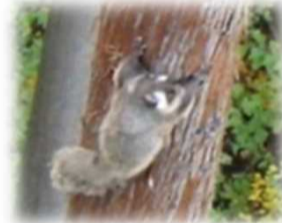
現場の足場に別荘を作ったムササビ君もお元気で!