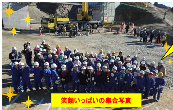
笑顔いっぱいの集合写真