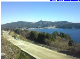
道路土工完了全景

工事場所：岩手県下閉伊郡山田町船越地内 工期：平成28年8月1日～平成30年2月15日