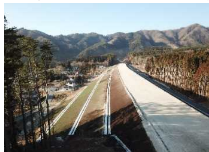
浪板地区盛土部全景