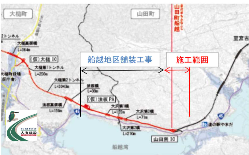
山田南IC 着工前 全景