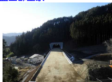
大槌第2トン側側～大槌第1トン側側