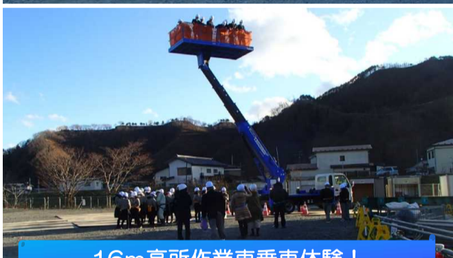
16m高所作業車乗車体験!