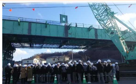
横桁架設を 間近で見学