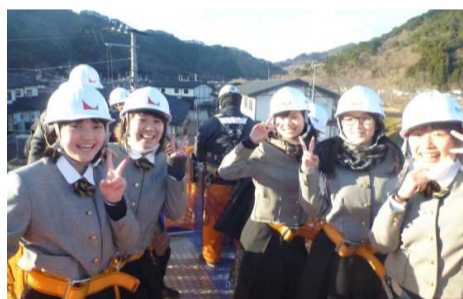
高所作業車上は黄色い歓声!