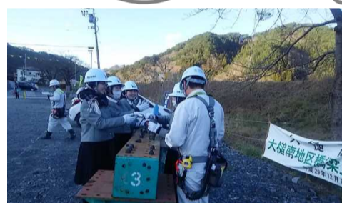
高力ボルト締付け体験

12月11日大槌高架橋南工区にて大槌高校1年生67人を対象とした日本ファブテック(株)主催の現場見学会を開催しました。見学会では大槌高架橋の概要や構造の説明と架設状況を見学していただきました。高所作業車の試乗では黄色い歓声が大槌に響きわたり、高力ボルトの締付け体験では、橋梁組立に真剣に興味を示す、将来の復興道路建設に係るかも知れない頼もしい生徒さんもいました。また、工事は今後も続き大変ご迷惑をおかけしますが、より良い橋を残す為に安全に作業を行ってまいりますので引き続きご理解とご協力をお願いいたします。