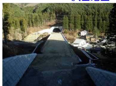
大槌第1トン側側～大槌第2トン側側