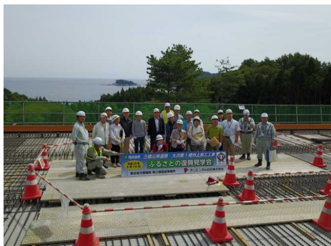
橋面にて集合写真を撮影