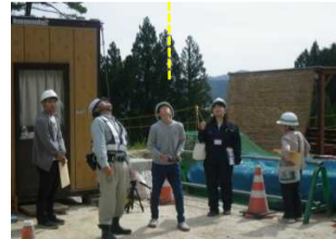
記念(祈念)ブロックを設置