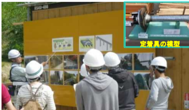
大沢第1橋施工の説明