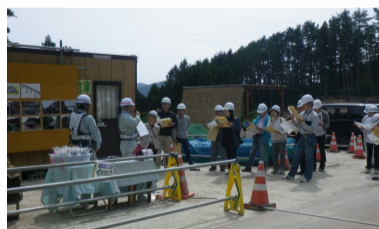
南三陸国道職員による事業説明