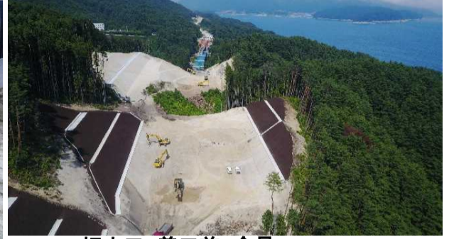
切土工 着工前 全景