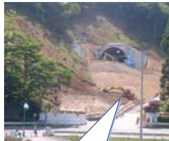
山を削っています。