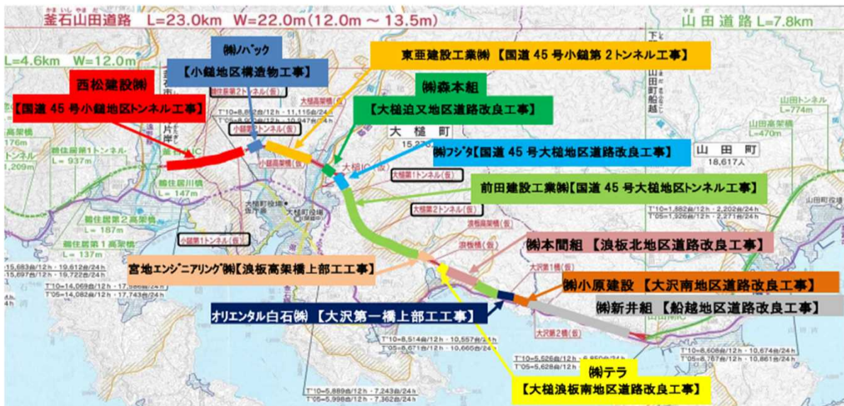
【釜石安全協議会 構成会社 施工箇所位置図】

協議会会員である『西松建設(株)』『東亜建設(株)』『前田建設工業(株)』『宮地エンジニアリング(株)』『(株)テラ』『(株)森本組』『(株)ノバック』『(株)本間組』『(株)新井組』『(株)小原組』『(株)フジタ』『オリエンタル白石(株)』12社並びに国土交通省南三陸国道事務所の工事関係者の皆様と共に工事の安全と復興道路の1日も早い完成を祈願して参りました。協議会メンバー一同、安全第一で工事を進めて参りますので、引き続きご協力をお願いします。