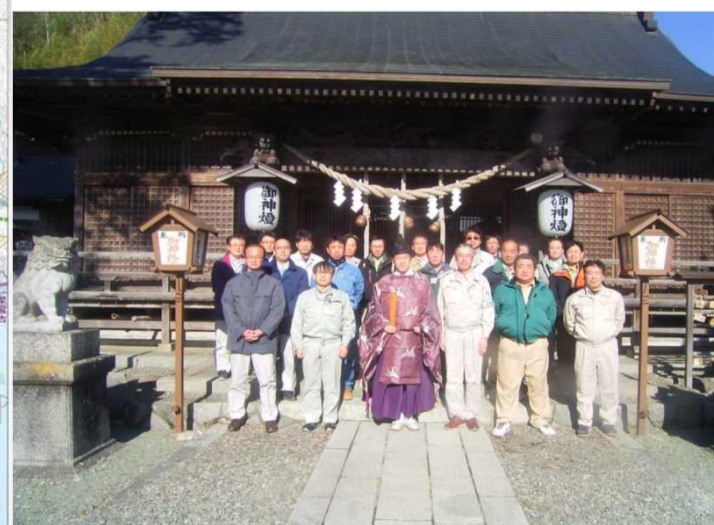
【小槌神社 平成29年1月13日】

※トンネルなど復興道路として整備されている釜石山田道路の見学を希望される方は、次のアドレスに掲載されている申し込み方法等をご確認して申込みください。 http://www.thr.mlit.go.jp/minamisanriku/kengaku/index.html