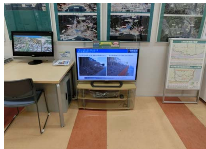
モニター設置放映状況

※トンネルなど復興道路として整備されている釜石山田道路の見学を希望される方は、次のアドレスに掲載されている申し込み方法等をご確認して申込みください。 http://www.thr.mlit.go.jp/minamisanriku/index.html