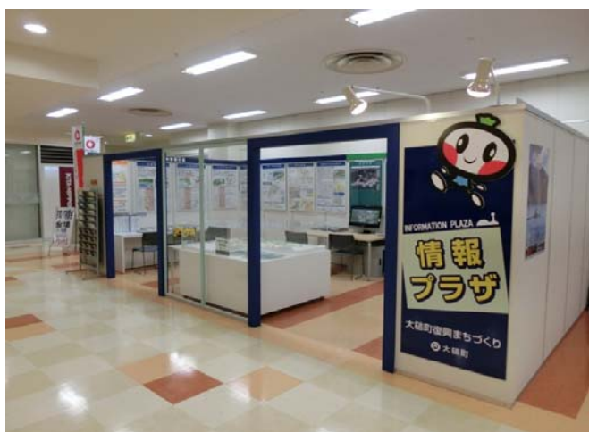
マスト内情報プラザ

現在、釜石山田道路の工事進捗状況を広く皆様にお知らせするため、シーサイドタウンマスト(大槌町)2Fの『大槌町復興まちづくり情報プラザ』にモニターを設置して、工事進捗状況を放映しています。 この情報プラザは、大槌町内の復興まちづくりに関する様々な情報を随時入手できるように設置された情報発信拠点です。 釜石山田道路の工事進捗状況は毎月データを更新し、新しい情報を提供できるように心掛けています。 また、同じ映像は、釜石市役所(第1庁舎 1F 市民課)、大槌町役場(1F 町民室)に設置したモニターでも見る事ができるので、近くにお寄りのときは是非ご覧ください。