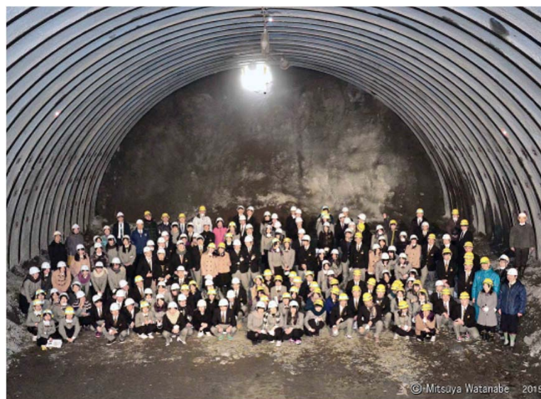
トンネル貫通を見学した県立大槌高校生徒と記念撮影

※トンネルなど復興道路として整備されている釜石山田道路の見学を希望される方は、次のアドレスに掲載されている申し込み方法等をご確認してお申込みください。 http://www.thr.mlit.go.jp/minamisanriku/index.html