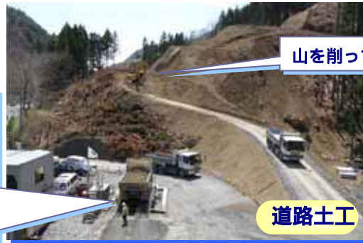
山を削っています。

工事場所：岩手県釜石市両石町第3地割～鶴住居町第26地割地内 工期：平成18年9月21日～平成19年6月20日 工事内容：道路土工 掘削工 66,300m 3 法面工 植生基材吹工 9,060m 2 排水工 側溝工 336m