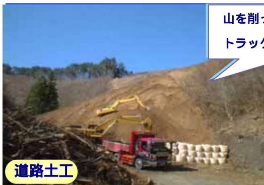
山を削って、削った土砂をトラックに積んでいます。

工事場所：岩手県釜石市両石町第4地割地内 工期：平成18年9月29日～平成19年6月29日 工事内容：道路土工 掘削工 75,000m 3 法面工 アンカー工 59本 鉄筋挿入工 174本 植生基材吹付工 4,000m 2