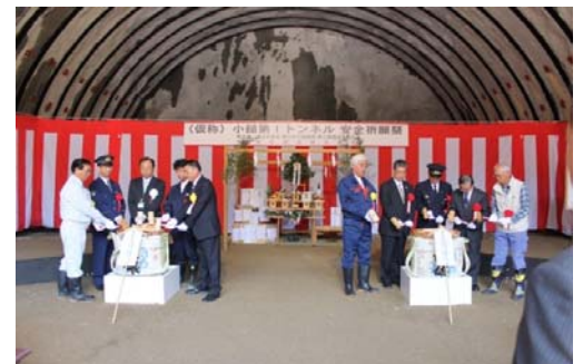
関係者による鏡割り

この日は、地元関係者や工事関係者など、約60人が参加し、工事の安全と被災地の一日も早い復興を祈願しました。