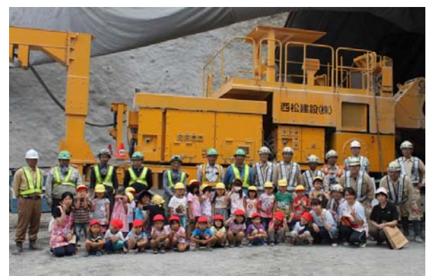
園児と施工者が一緒に記念撮影