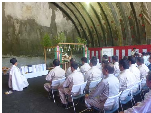
トンネル掘削工事の安全祈願

平成26年7月22日(火)、三陸沿岸道路(釜石山田道路)工事の一環として施工する(仮称)大槌第1トンネル(L=256m)の安全祈願祭が、同トンネル終点側坑口で行われました。当区間の大槌町大槌～吉里吉里地内で整備される大槌地区トンネルは、近接する大槌第1・第2トンネルを一つの工事で実施しており、昨年11月に着工した大槌第2トンネルに引き続き、今回は大槌第1トンネルの掘削が開始することから、安全祈願祭を行ったものです。