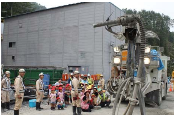
吹付機をリモコンで操作する園児達

平成26年7月9日(水)、(仮称)鵜住居第2トンネル終点側において、鵜住居幼稚園園児26名による現場見学会が行われました。