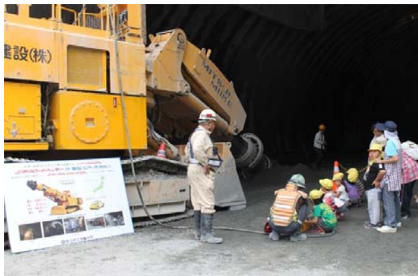
自由断面掘削機をリモコンで操作する園児達

未来を担う園児達には、機械に直接触れることでトンネルや道路工事に興味をもっていただけたようです。