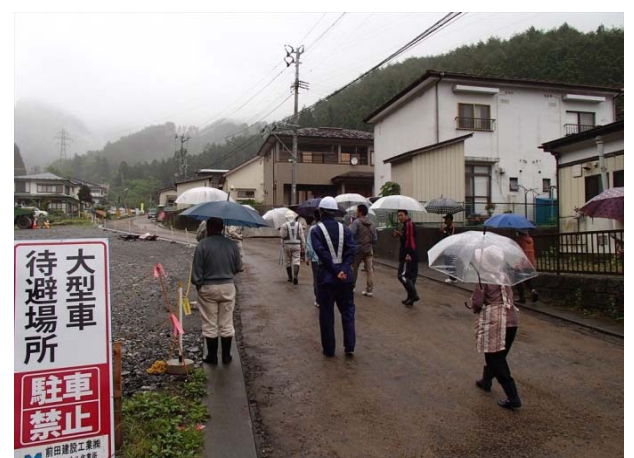
地域住民と合同で行った安全点検