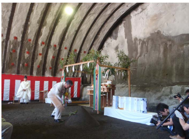
工事関係者による歛入れ

また、当地区では、本格的な工事開始に向けて、6月8日に地域住民と合同で安全点検を実施しており、無事故・無災害に取り組んでいるところです。