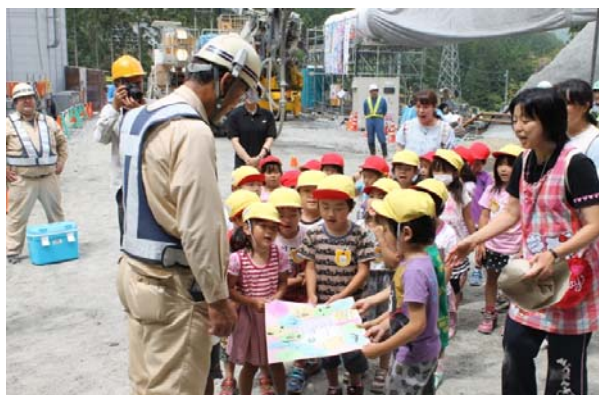
園児達より感謝状を贈呈される