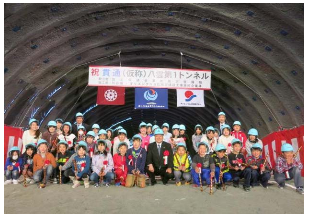
双葉小学校5年生記念撮影