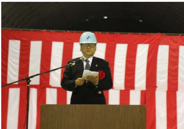
野田市長による挨拶

式典では、参列者の代表が貫通発破を点火し、トンネルを貫通させました。その後、釜石市長をはじめ、地元関係者、発注者、施工者らが貫通点で握手を交わした外、双葉小学校児童による演舞、鏡開き、乾杯、万歳唱和など、参列者全員で釜石山田道路の順調な工事進捗を喜びました。