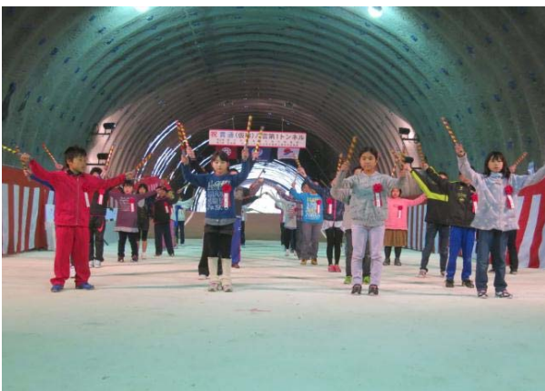
双葉小学校児童による演舞