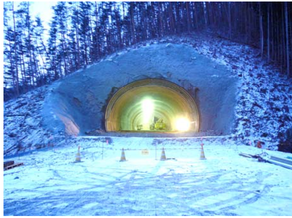
貫通した(仮称)八雲第3トンネルの状況