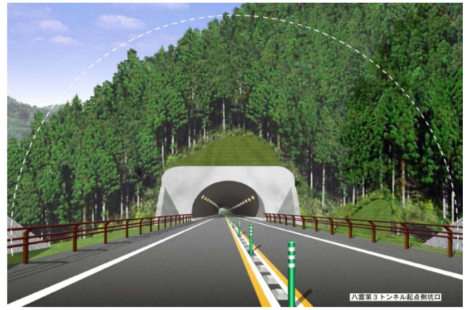
(仮称)八雲第3トンネル(起点側)完成予想図