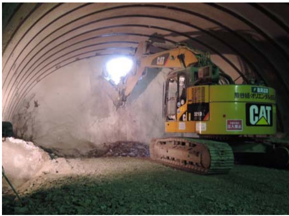
掘削機械による貫通状況

2月4日(火)、三陸沿岸道路「釜石山田道路」(延長23km)の(仮称)釜石中央IC～釜石両石IC間に位置する(仮称)八雲第3トンネル(149m)が貫通しました。同区間では、(仮称)八雲第2トンネル(839m)、(仮称)水海トンネル(445m)に続く3番目の貫通となります。(仮称)八雲第3トンネルは、昨年11月末から掘削を開始し、周辺地域の皆様のご理解・ご協力を賜りながら、約2ヶ月での貫通となりました。工事は順調に進んでおり、残る(仮称)八雲第1トンネル(635m)についても、間もなく貫通を迎える見通しとなっています。周辺地域の皆様には引き続きご迷惑をお掛け致しますが、震災復興のリーディングプロジェクトとして一日も早い供用を目指し、地域一体となって工事を進めて参りますので、今後とも工事へのご理解・ご協力をお願い致します。