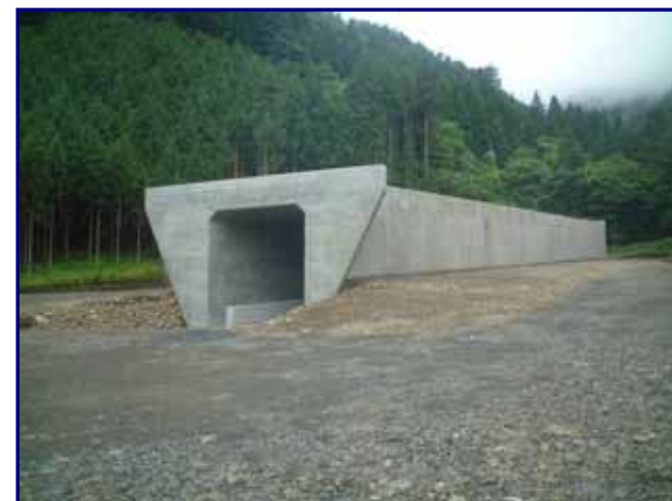
コンクリート函渠部