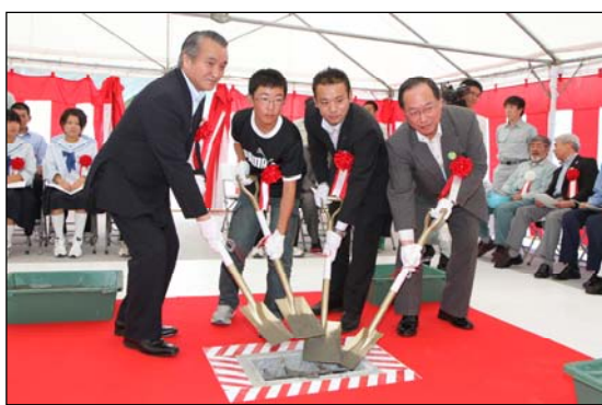
式典参列者による連結コンクリート打設