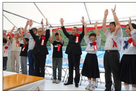
無事に連結を終え参列者全員で万歳唱和