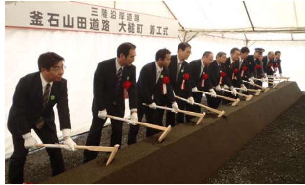
関係者代表による鍬入れ