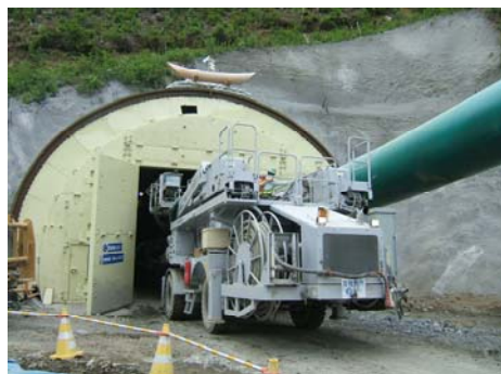
水海トンネル 起点坑口

初夏のさわやかな風が木々の緑とたわむれる頃となりました。皆様如何お過ごしでしょうか。 各トンネルも順調に推移し、上記のとおり掘削進捗となっております。 また、水海トンネルでは防音扉を設置するなど、騒音・振動などに細心の注意を払い施工しておりますので、引き続き工事へのご理解とご協力の程よろしくお願致します。