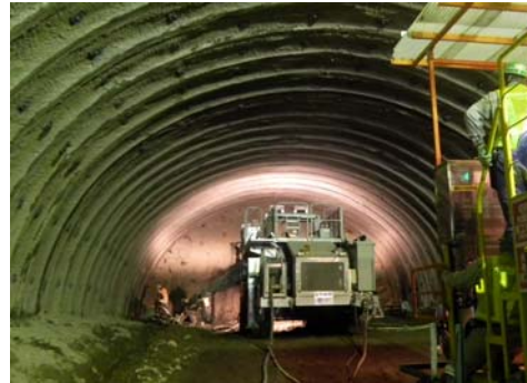
水海トンネル 施工状況(爆薬装填中)

ご意見・ご感想をお寄せ下さい。 国土交通省 東北地方整備局 南三陸国道事務所 建設監督官(釜石山田道路担当) 〒026-0301 釜石市鶴住居町第7地割13-7 TEL:0193-29-1625 FAX:0193-29-1645 ホームページ URL: http://www.thr.mlit.go.jp/minamisanriku/index.html