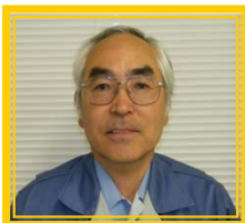
(現場代理人：堂藤和雄)

初夏のさわやかな風が木々の緑とたわむれる頃となりました。皆様如何お過ごしでしょうか。 各トンネルも順調に推移し、上記のとおり掘削進捗となっております。 また、水海トンネルでは防音扉を設置するなど、騒音・振動などに細心の注意を払い施工しておりますので、引き続き工事へのご理解とご協力の程よろしくお願致します。