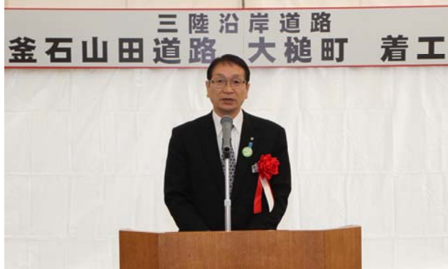
あいさつする大槌町長