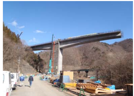
P2橋脚 張出し施工(完了)