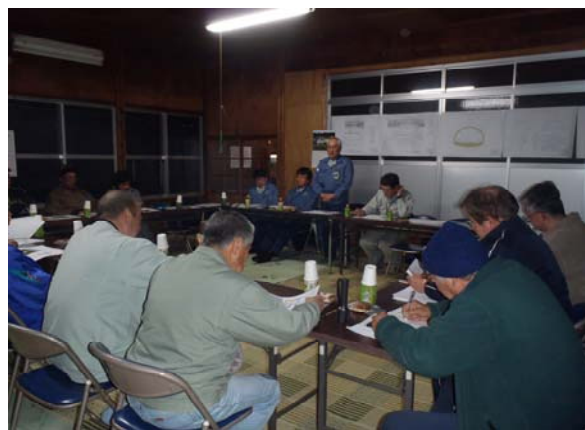
工事説明会の開催状況

春の足音がようやく聞こえて来たかな、という毎日ですが、皆様如何お過ごしでしょうか。この度、水海トンネルの掘削に着手することとなりました。近隣地域の皆様にはご迷惑をお掛け致しますが、皆様との絆を大切に、ご理解とご協力を賜りながら、円滑な工事施工に努めて参りますので、引き続きよろしくお願い致します。