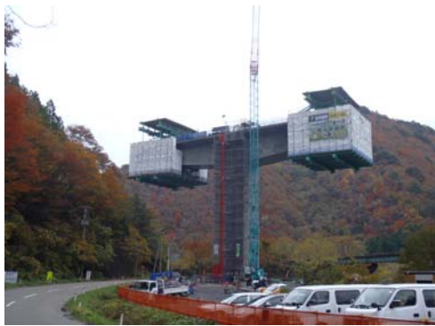
P2橋脚 張出し施工(5ブロック目) (平成24年11月)