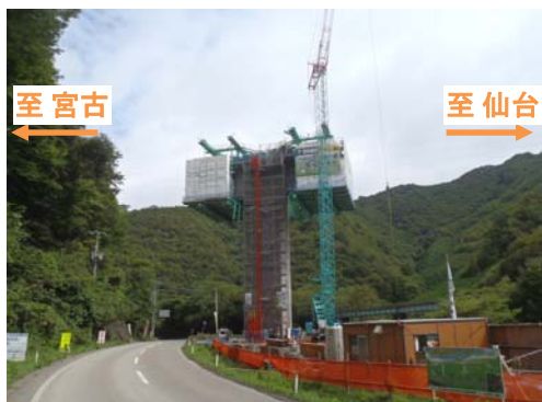
P2橋脚 張出し施工(1ブロック目) (平成24年9月)

水海高架橋(L=184m)は、昨年6月から上部工の施工に着手し、P2橋脚を起点とした14ブロックの張出し施工が本年2月に完了しています。引き続き、P1橋脚を起点とした張出し施工およびP2橋脚～A2橋台間の上部工施工を行っています。