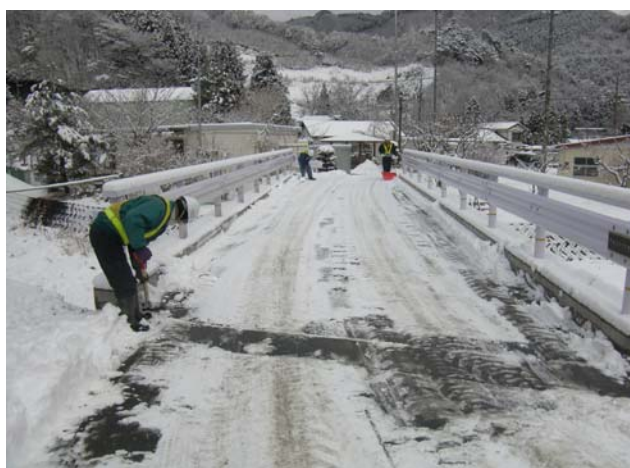
市道鶴住居34号線における除雪状況