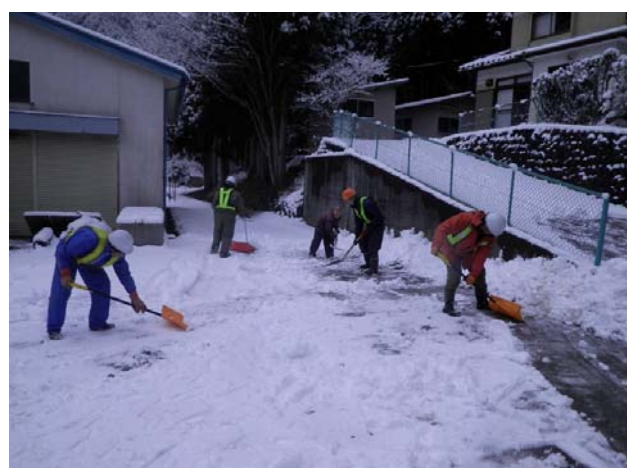
女遊部地区で除雪を手伝う工事関係者