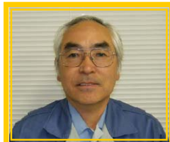
(現場代理人：堂藤和雄)

暦の上では立春を迎えましたが、まだまだ春には遠い寒い日が続く今日この頃、皆様におかれましてはいかがお過ごしでしょうか。トンネルの掘削に着手し早4ヶ月が経過致しました。現在、工事は順調に進んでおりこれもひとえにご近隣の地域の皆様方をはじめ、関係機関の方々のご理解とご協力の賜と感謝の念に堪えません。4月より、3本目のトンネルとなります水海トンネルの掘削に着手する予定です。工事の実施にあたっては、近隣住民の方々を対象に説明会を開催致しますので、皆様方のご出席をお願い致します。今後とも安全施工に心掛け、早期完成に向けて努力して参りますので引き続き工事へのご理解とご協力の程よろしくお願い致します。