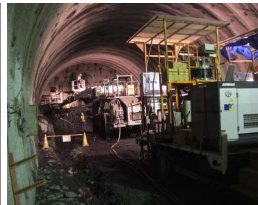
八雲第2トンネル 施工状況

ご意見・ご感想をお寄せ下さい。 国土交通省 東北地方整備局 南三陸国道事務所 建設監督官(釜石山田道路担当)