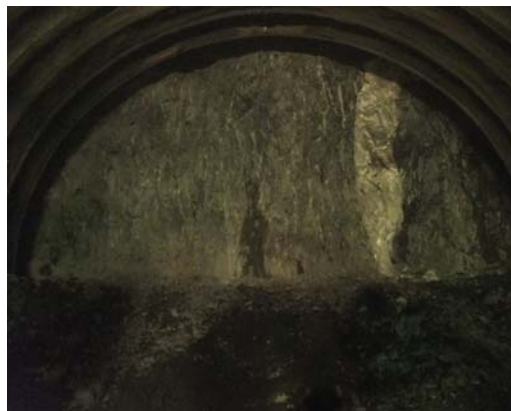
八雲第2トンネル 坑口より162m地点

暦の上では立春を迎えましたが、まだまだ春には遠い寒い日が続く今日この頃、皆様におかれましてはいかがお過ごしでしょうか。トンネルの掘削に着手し早4ヶ月が経過致しました。現在、工事は順調に進んでおりこれもひとえにご近隣の地域の皆様方をはじめ、関係機関の方々のご理解とご協力の賜と感謝の念に堪えません。4月より、3本目のトンネルとなります水海トンネルの掘削に着手する予定です。工事の実施にあたっては、近隣住民の方々を対象に説明会を開催致しますので、皆様方のご出席をお願い致します。今後とも安全施工に心掛け、早期完成に向けて努力して参りますので引き続き工事へのご理解とご協力の程よろしくお願い致します。