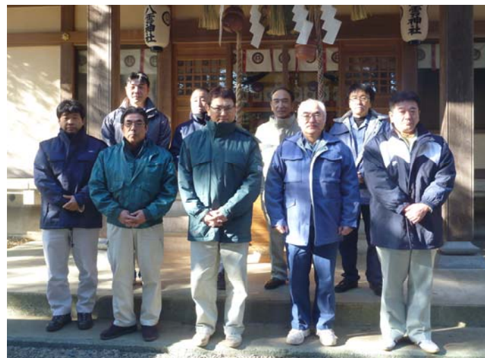
釜石山田道路安全協議会のメンバー(八雲神社にて)

工事や事業に関するお問い合わせ・ご意見等がございましたら、お気軽にご連絡下さい。