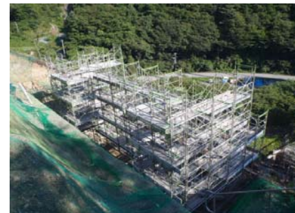
A1橋台足場組立完了