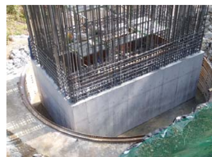
P1橋脚1ロット目打設完了