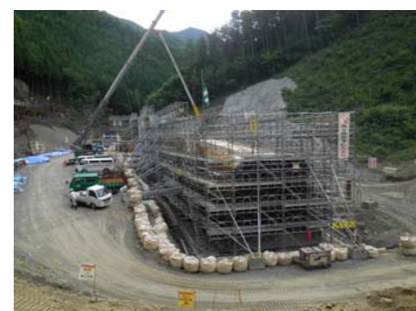
函渠工の施工状況