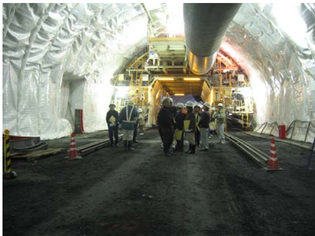
トンネル坑内見学状況 (トンネル壁面に取り付けてある白いシートは防水シートというもので、浸み出した地下水を遮断します。)