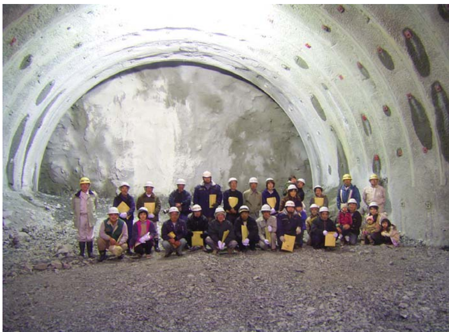
トンネル坑内切羽前にて記念写真 (後ろの盤は、トンネル掘削先端の切羽と言いまして岩盤にコンクリートを吹き付けて固めています。)