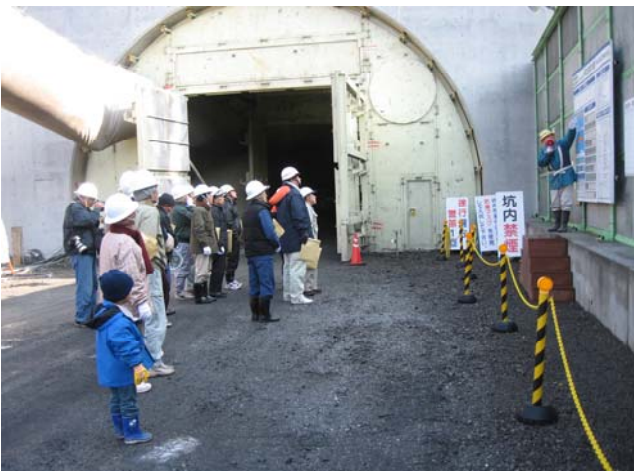
工事概要の説明状況 (坑口の工事掲示板の前で工事内容の説明をしています。)