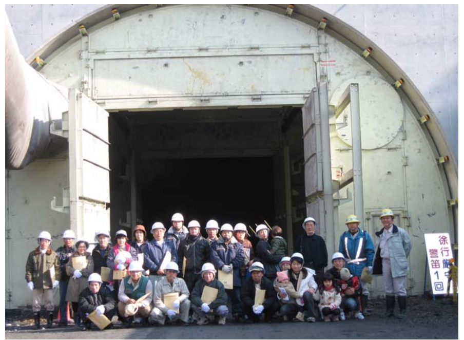
トンネル坑口にて記念写真 (後ろの鋼鉄製の扉は、防音扉です。発破音や重機騒音を遮断するために設置しています。)