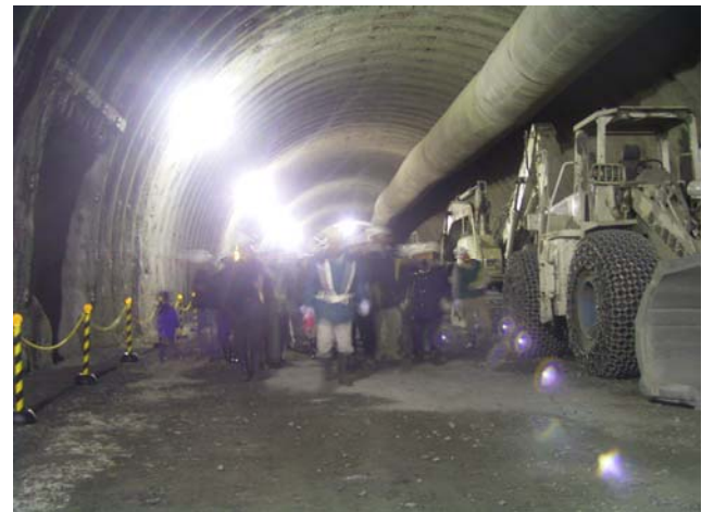
トンネル坑内見学状況 (右側にある機械は、トンネルを掘るときに使用する重機です。)