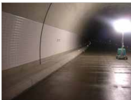
トンネルの左右の壁面に内装板が設置されました。