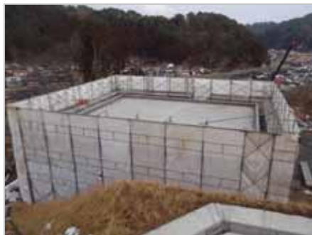
← 建物全体をシートで覆っています。見えているのは、屋上です。

工事現場は、日向グランド裏の地山を削った丘陵にあり、国道45号の長内橋付近からも確認できるようになりました。強風の中、急傾斜階段を登っての現場通いは厳しいものがありますが、あと1ヶ月、無事故・無災害での工期内完成を目指して頑張りますので、地域の皆様には今後ともご協力の程お願い申し上げます。