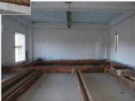
これから内装の仕上げに入ります。→