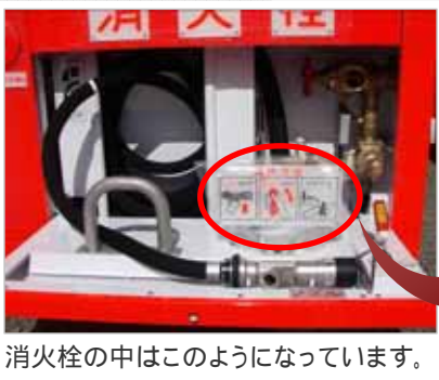
消火栓の中はこのようになっています。