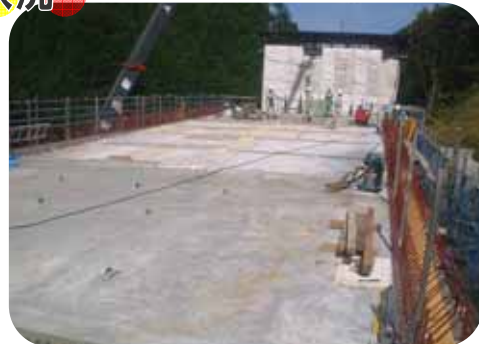
橋の上の状況です。