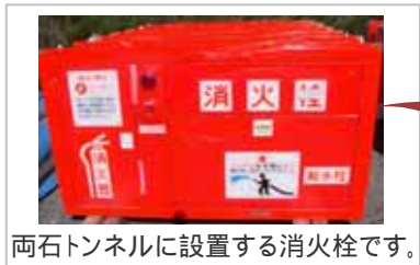
両石トンネルに設置する消火栓です。

これから先は、寒くなっていきますので、生まれも育ちも九州の佐賀の私には厳しいものになると思いますが、皆様もお風邪などひかれないう御注意ください。今後とも地域の皆様のご協力の程、よろしくお願いいたします。