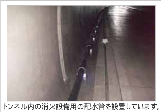
トンネル内の消火設備用の配水管を設置しています。