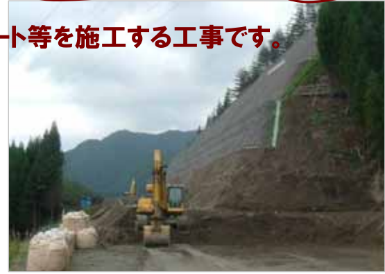
山の掘削工事は、ほぼ完成しました。

カルバート工は現在、底版の鉄筋・型枠組立作業を行っている最中です。今後、コンクリート打設作業に伴い、ミキサー車の現場への出入りが頻繁になり、ご迷惑をお掛けしますが、一般車両及び歩行者の安全を最優先に工事を進めてまいりますので、近隣住民の皆様には引き続きご協力のほどよろしくお願いいたします。