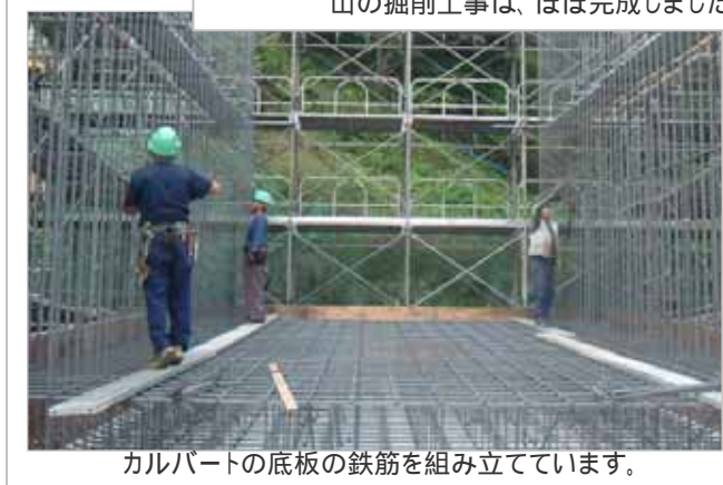
カルバートの底版の鉄筋を組み立てています。