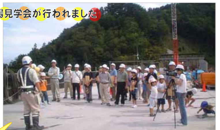
8月30日、鶴住居町新川原町内会、約30名の皆さんによる見学の様子です。地上約30mの橋の上からの景色を楽しんでいただきました。