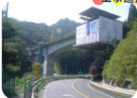
上部工工事も終盤にさしかかってきました。11月下旬には橋がつながる予定です。