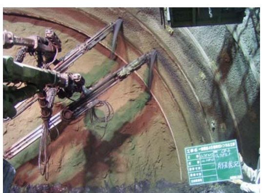
トンネルの壁面から放射状にロックボルト(長さ3~4mの鉄製の棒)を打込み、トンネルと地山を一体化させ補強します。