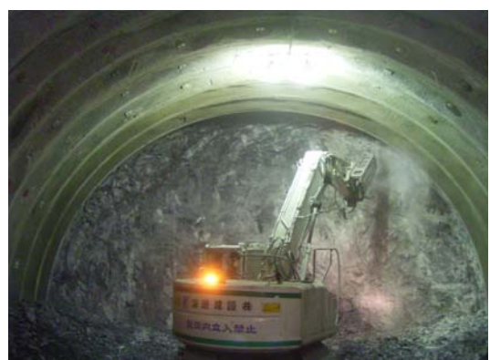
発破後の落下しそうな石、浮いた石を削岩機で落とし切羽表面を整えます。