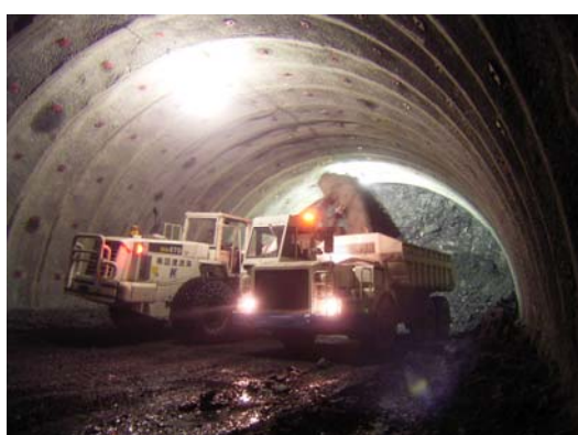
崩した岩(ズリ)をホイールローダーでダンプトラックに積み込んで坑外へ搬出します。