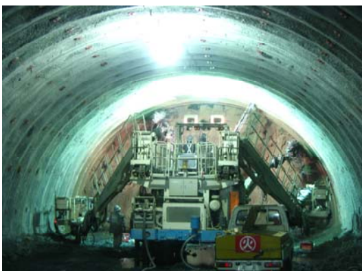
ドリルジャンボで切羽に穴をあけ、火薬をセットします。