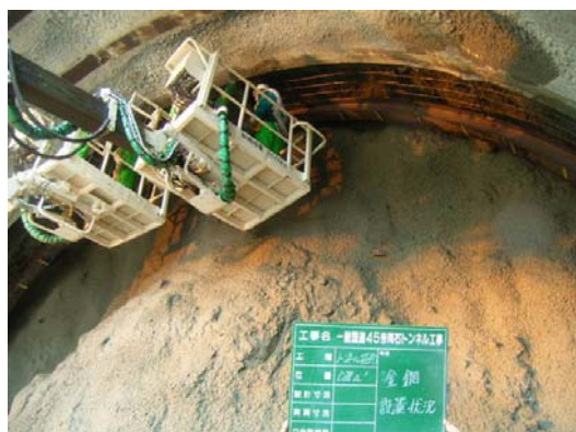
トンネルの形状に合わせた鋼製の枠を周囲に建込み、枠の間に金網を取付け地山の落下防止を図ります。