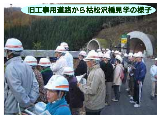
旧工専用道路から枯松沢橋見学の様子