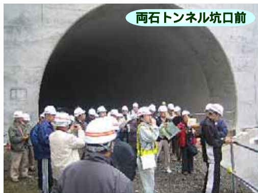
両石トンネル坑口前