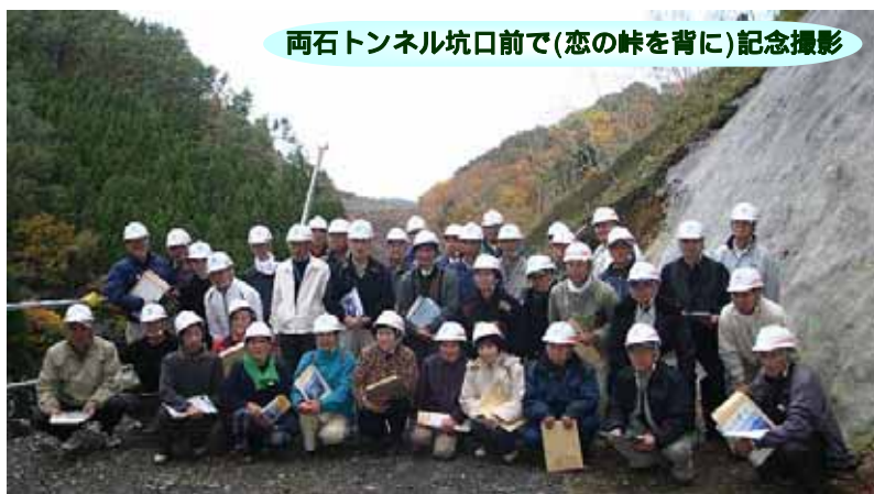
両石トンネル坑口前で(恋の峠を背に)記念撮影