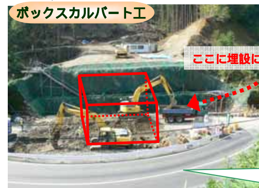
ボックスカルバート工