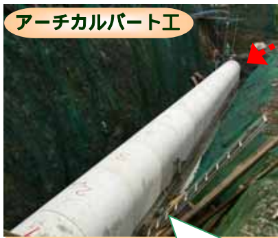
アーチカルバート工 アーチ状の鉄筋コンクリート水路を埋設する工事をしています。

9月上旬より釜石遠野線を通すための現場打函渠を施工しております。道路を迂回させての工事になり、地域の皆様及び、通行する皆様には大変ご迷惑をお掛けしております。 安全作業を優先して工事を行いますのでご協力のほどよろしくお願い致します。