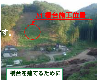
A1 橋台施工位置 橋台を建てるために山を削っています。