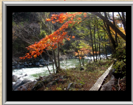
「嘉相滝遊歩道」小林 宏一