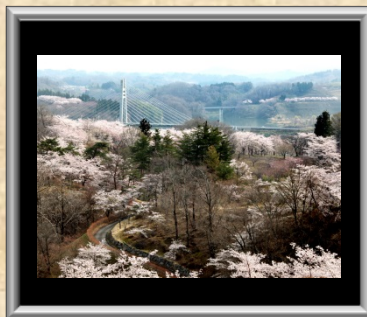
「さくらの公園」小林 正夫