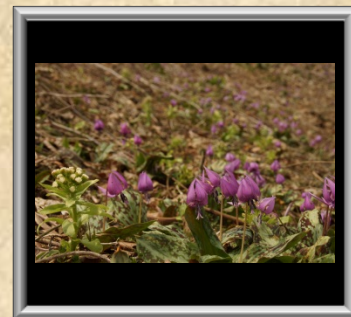
「カタクリ群生」近藤 広章