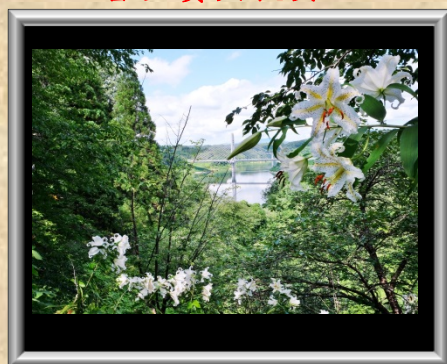
「山百合の乱舞」木目沢 善喜