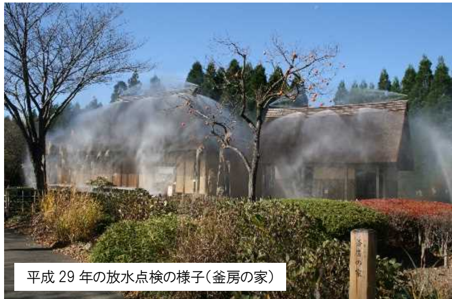
平成 29 年の放水点検の様子(釜房の家)