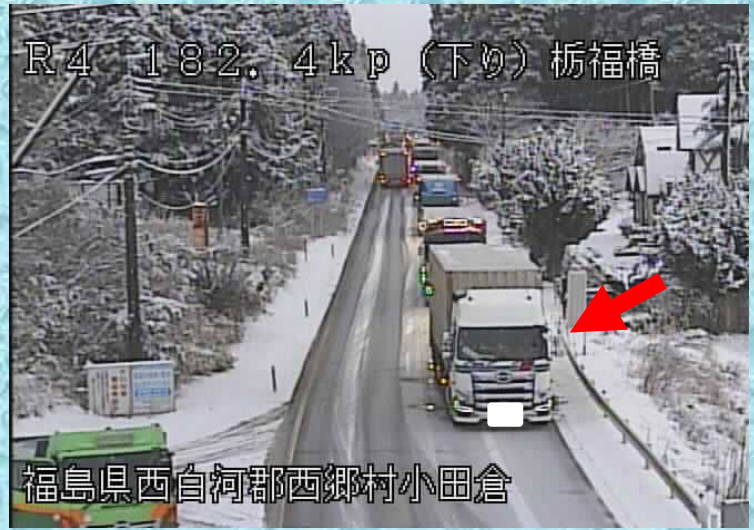
R4 182.4kp (下り) 栃福橋