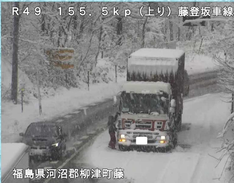
R49 155.5kp (上り) 藤登坂車線