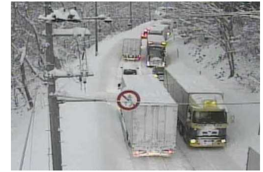
【写②】R3.12.28 国道7号の交通混雑状況