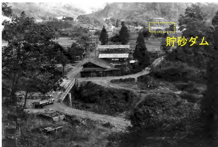
ほととゆだ駅付近から 貯砂ダム方面を望む(昭和36年)