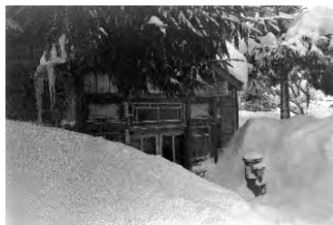
川尻派出所(昭和36年)