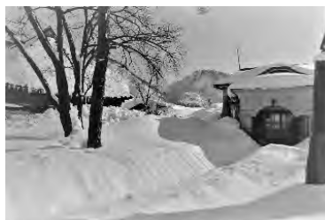
川尻郵便局(昭和36年)