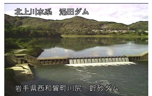
北上川水系 湯田ダム