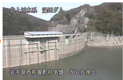
北上川水系 湯田ダム