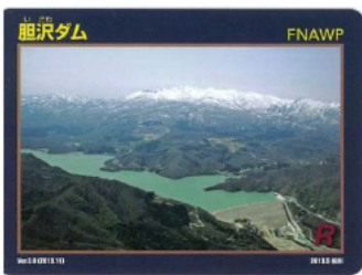
Ver.3.0(現在、配布していません)

先月号でもお知らせしましたが、4月からダムカードが新しくなりました！好評配布中です。