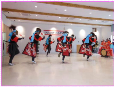
伝統芸能『市野々念仏剣舞』

交流館には、休憩スペースやお土産コーナーもあるよ!! セレモニー当日は、伝統芸能である「市野々念仏剣舞」が披露されたよ! ハハッ!