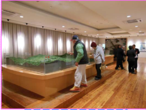
奥州湖交流館の内観