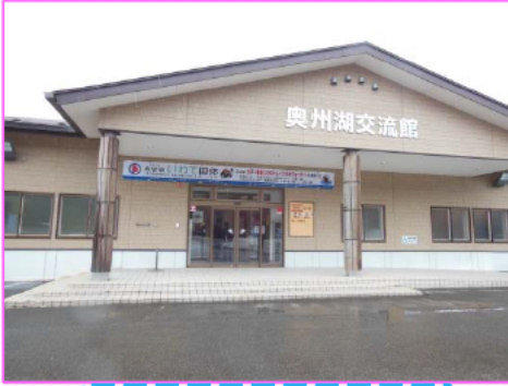
奥州湖交流館の外観