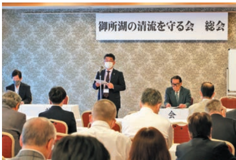
北上川ダム統合管理事務所長よりご祝辞