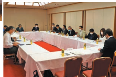
同日午前中には役員会が行われ、議題について確認されました。

御所湖の清流を守る会では、5月18日(木)盛岡つなぎ温泉ホテル紫苑を会場に、第43回定期総会を開催しました。過去3年間はコロナ禍により書面決議としておりましたが、この度4年ぶりに対面開催となり委任状を含む74名が出席されました。