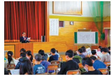
真剣に聞き入る太田小児童のみなさん