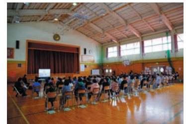
御所ダム40周年記念の記録映像も鑑賞しました