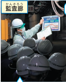
かんきょう 監査廊