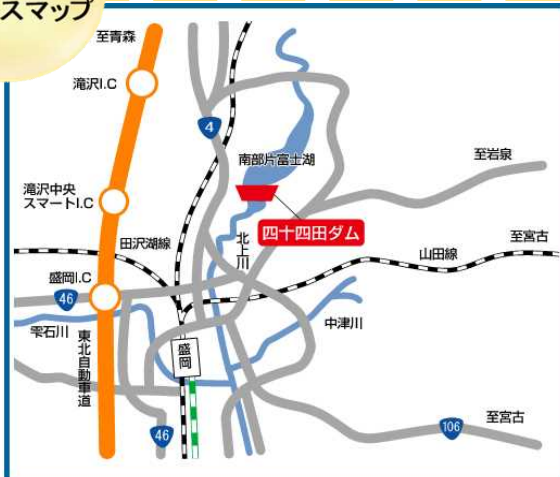
四十四田ダム アクセスマップ