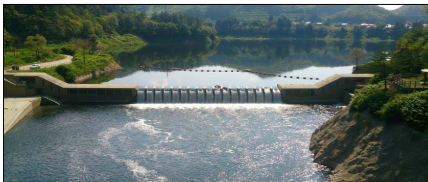
錦秋湖大滝全景（水のカーテン）

■駐車場内の看板に【開放中】、【閉鎖中】の表示をしますので、見学の際は参考にご覧ください。