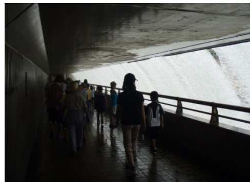
錦秋湖大滝内部の見学状況