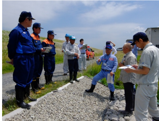
▲吉田川右岸12.4k(幡谷)重点監視区間の巡視