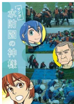
▲防災教育資料として作成した「マンガ 水防団の神様」※ 当日、参加者へ配布