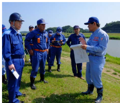
▲鳴瀬川左岸4.0k(小野)重要水防箇所の巡視