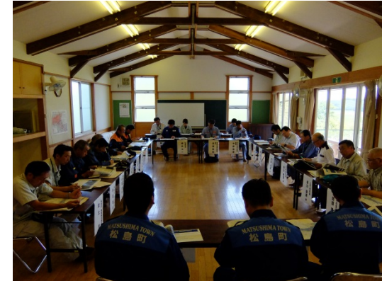
▲松島町 意見交換会の様子