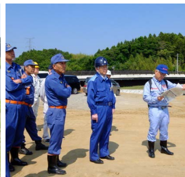
▲鳴瀬川左岸7.8k(西福田)重要水防箇所の巡視