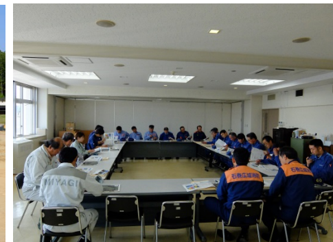
▲東松島市 意見交換会の様子