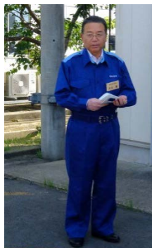
▲東松島市巡視前の東松島市長の挨拶