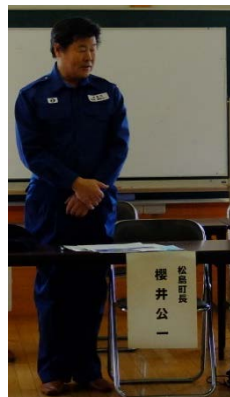
▲松島町巡視前の松島町長の挨拶