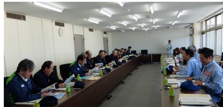
▲小牛田地区 意見交換会の様子