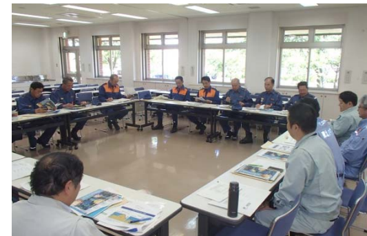
▲古川地区 意見交換会の様子