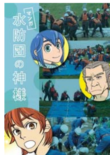
▲防災教育資料として作成した「マンガ 水防団の神様」※ 当日、参加者へ配布