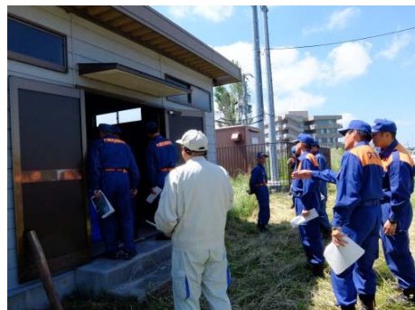
▲江合川右岸27.4k「福沼水防倉庫」の巡視