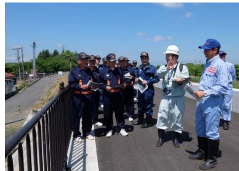
▲江合川右岸18.8k付近（南小牛田）重要水防箇所の巡視