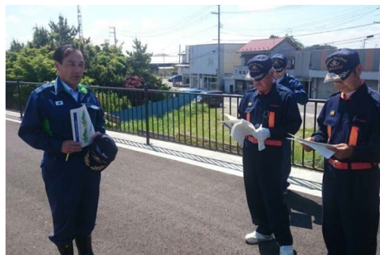
▲「小牛田地区」巡視前の美里町長の挨拶