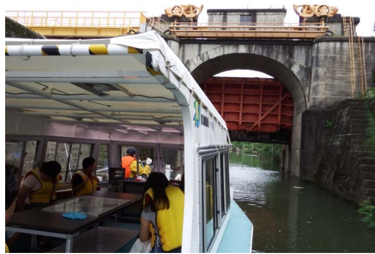
脇谷閘門をくぐる様子