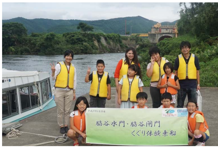
乗船者にて集合写真