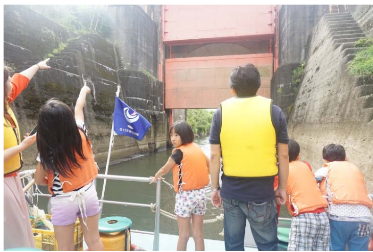
脇谷閘門が動く様子に歓声があがります