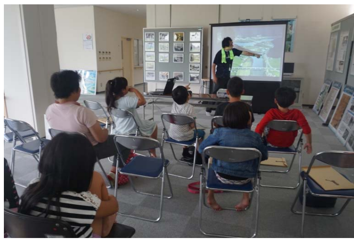
閘門の仕組みについて説明

○平成29年8月20日 石巻市子どもセンターらいつと「かわ探検（脇谷水門・閘門くぐり体験乗船）」を開催し、小学生8名にご参加いただきました。 ○参加者の皆さまには、北上川・旧北上川の分流施設の歴史や、閘門の仕組みについて説明を聞いたあと、岩手河川国道の船「ゆはず号」に乗船し、脇谷水門・閘門の通過を体験していただきました。 ○参加した小学生は、閘門や水門の大きさや、川の大きさに驚いた様子でした。