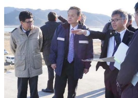
▲復旧事業完成状況の確認を行う