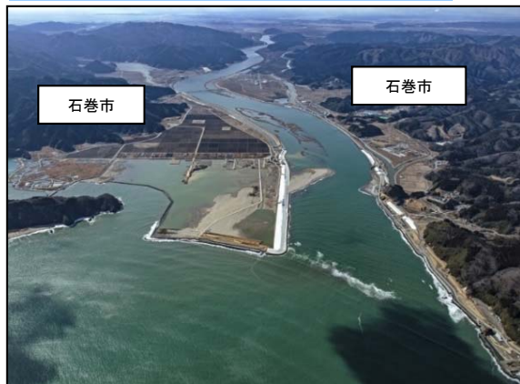
復旧完了（2017年2月8日撮影）

死者：3,548人、行方不明：427人 建物被害56,701棟 ※平成28年2月29日時点の石巻市合計