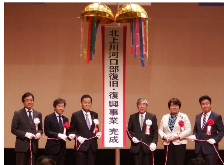
▲セレモニーの様子

石巻市の復興計画と整合を図り、海岸堤防と一連になって効果を発揮するように河川堤防等の整備が概成したことから式典を開催。