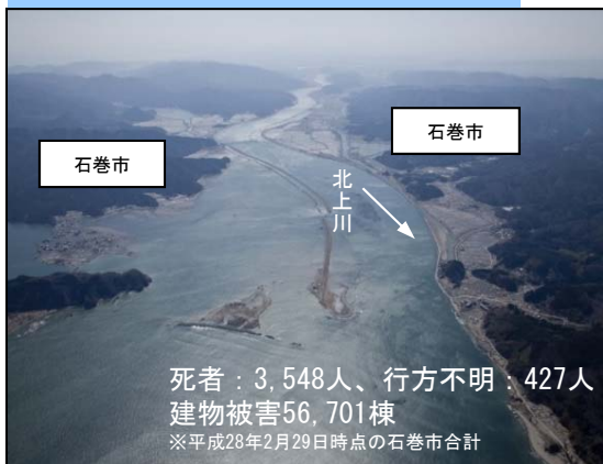
震災後（2011年4月17日撮影）

死者：3,548人、行方不明：427人 建物被害56,701棟 ※平成28年2月29日時点の石巻市合計