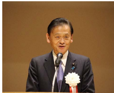
▲末松信介国土交通副大臣挨拶