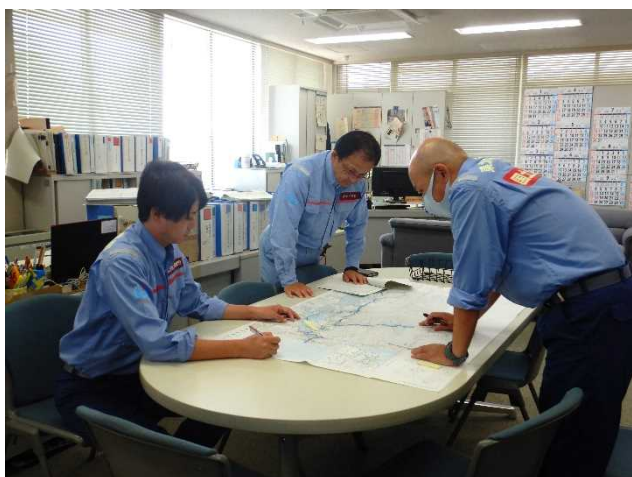
▲当日の訓練実施状況

北上川下流河川事務所では令和5年9月1日（金）大規模地震発災時の防災能力向上を図るため「被災状況の迅速かつ的確な情報伝達」や「情報共有など」の初動対応訓練を実施しました。