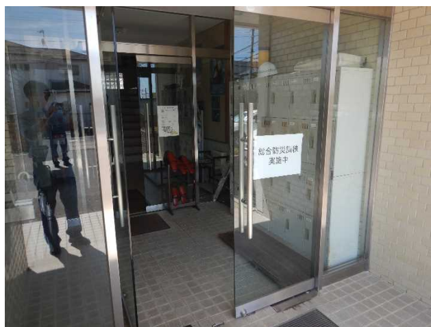
▲当日の訓練実施状況