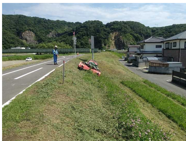
▲遠隔式除草機械による除草状況