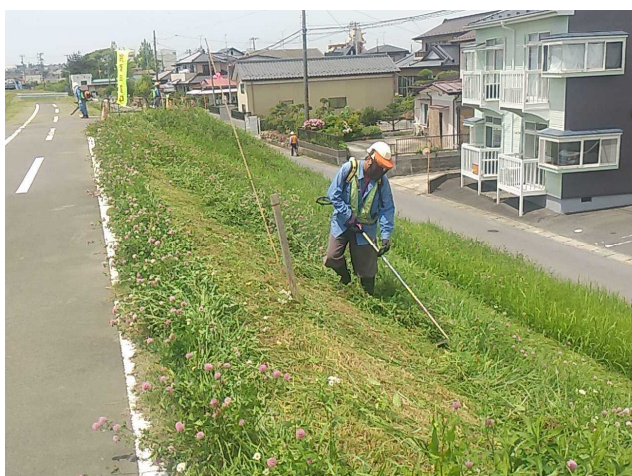
▲人力（肩掛式）による除草状況